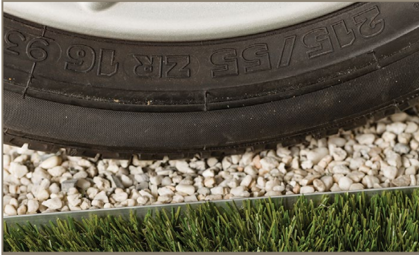
BERA® Bordures ALU - L Pro