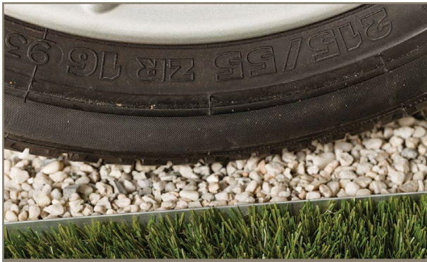
BERA® Bordures ALU - L Pro