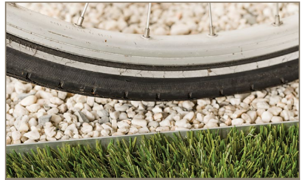
BERA® Bordures ALU - L Pro

Les bordures résistent aisément à la circulation par des véhicules grâce à sa base large et stable.